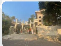
福州大学美術アカデミー