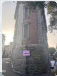
最も美しいコーナー